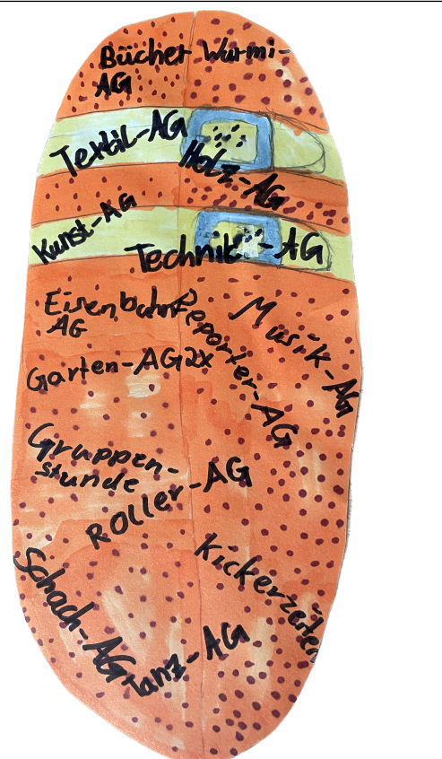
AG-Plan Stand 07.06.2023